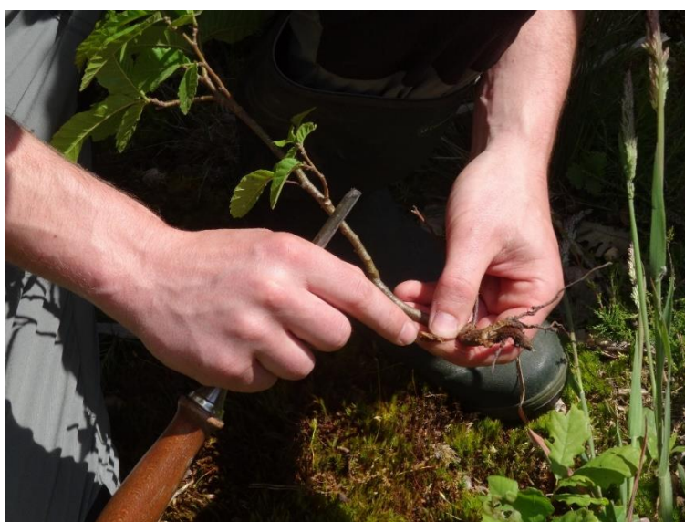
Figure 3. Prélèvement et analyse d'un échantillon de châtaignier au test ELISA pour déceler la présence de l'encre du châtaignier ( Phytophthora cambivora ).

oomycètes forment rapidement de nouvelles zoospores qui peuvent ainsi contaminer d'autres arbres, ce qui est à l'origine d'une distribution par foyer des arbres malades dans les parcelles. P. cinnamomi et P. cambivora peuvent de plus se maintenir et se multiplier dans le sol. Leur dispersion dans le sol est privilégiée par des excès d'eau. Ils sont de plus disséminés par le biais des plants et substrats infectés. Ainsi, il est crucial de vérifier l'état sanitaire des plants utilisés lors d'une nouvelle plantation.