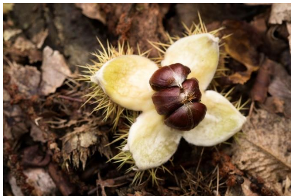
Figure 1. Châtaignes dans leur bogue (cupules épineuses).