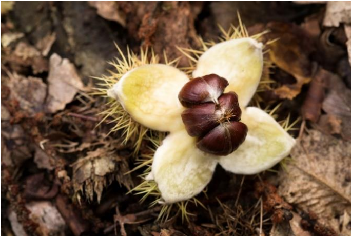
Kuva 1. Kastanjat kuoressaan (piikkiset kupit).