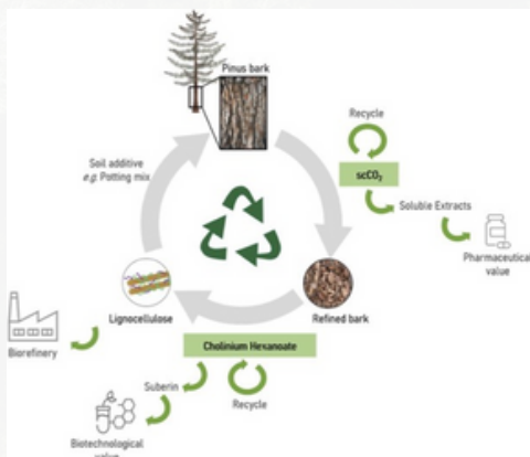
Figure 1. Kaaviomalli mahdollisesta kestävästä kuoren biojalostamosta

Montereynmännyn kuori on metsätähde, jota on uusiutuvana raaka-aineena runsaasti saatavilla ja joka on pääasiassa vajaakäytössä tai poltetaan energian ja lämmön tuottamiseksi. Useat tutkimukset ovat kuitenkin osoittaneet, että montereynmännyn kuori sisältää korkean osuuden fenolisia yhdisteitä ja suberiinia - yhdisteitä, joilla on potentiaalia innovatiivisten bakteereja tappavia ominaisuuksia sisältävien materiaalien kehittämiseen. Tässä hankkeessa mentiin vielä askel pidemmälle käyttämällä vihreää strategiaa uuttamalla kuoren lipofiiliset ainesosat ja suberiini ylikriittisellä hiilidioksiduutolla (scCO 2 ) eri lämpötiloissa ja paineissa biomateriaalisella ionisella nestekatalyytillä. Tällä tekniikalla saadut uutteen sisälsivät pääasiassa hartsihappoja, kun taas suberiini sisälsi runsaasti karboksyylihappoja, mikä on harvinaista muissa raaka-ainelähteissä.